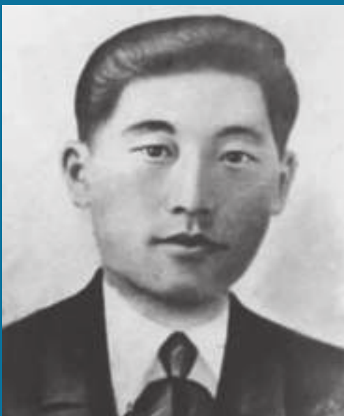
Герой Советского Союза Александр Павлович Мин (1915–1944 гг.)